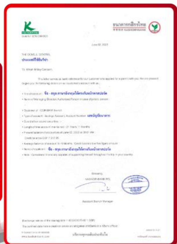
ตัวอย่าง Bank Guarantee ที่ผู้สมัครต้องขอธนาคาร