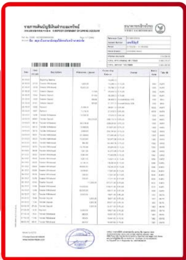
ตัวอย่าง Bank Statement ที่ผู้สมัครต้องขอธนาคาร

3.4 ปรับสมุดบัญชีธนาคารตัวจริง และเตรียมไปในวันที่ยื่นวีซ่า